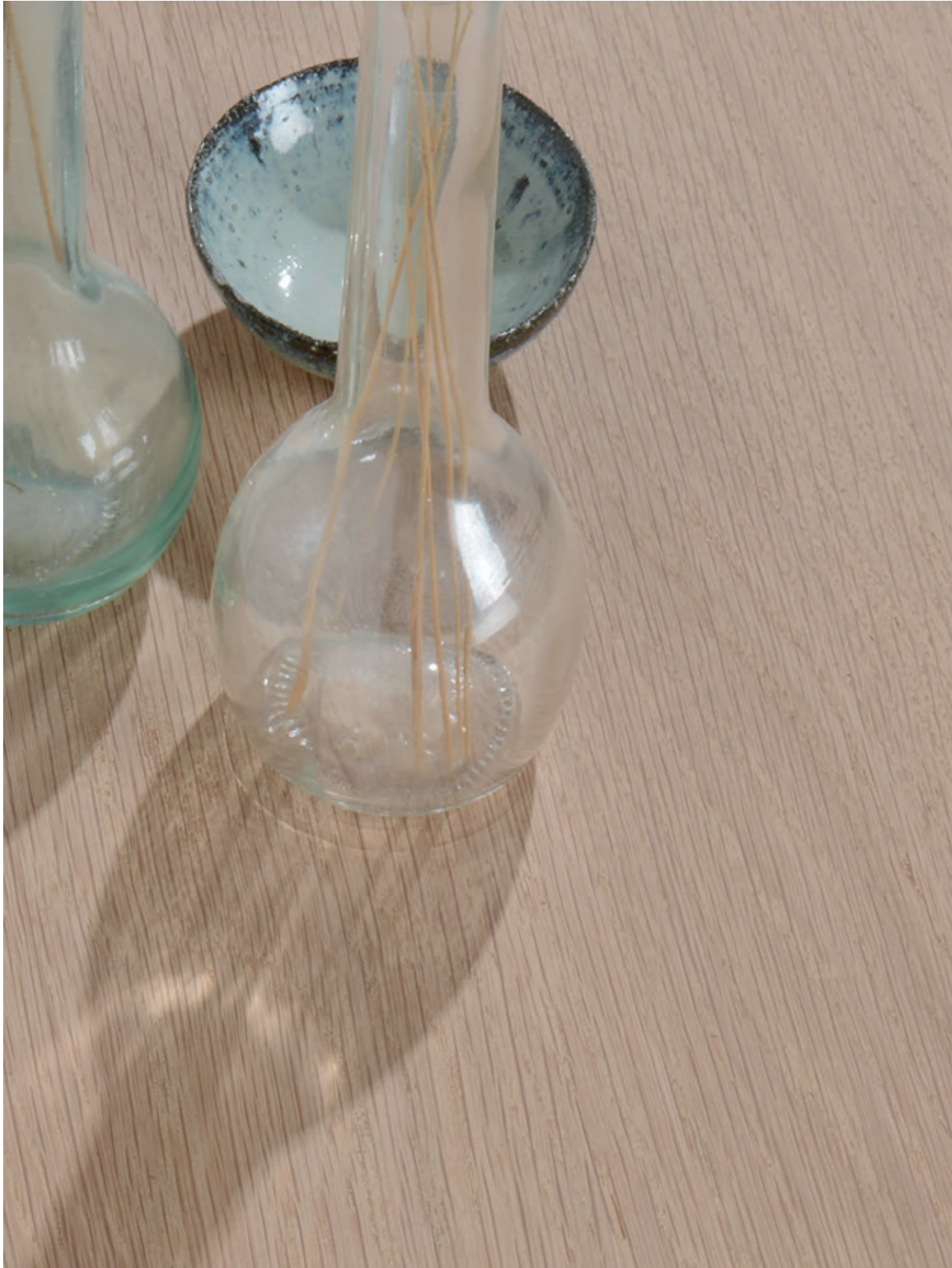
Bleu De Chauffe x Drageot Manufacture